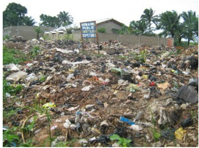
Ramassage des Déchets Solides Ménagers Assainissement de l'Environnement (AE)