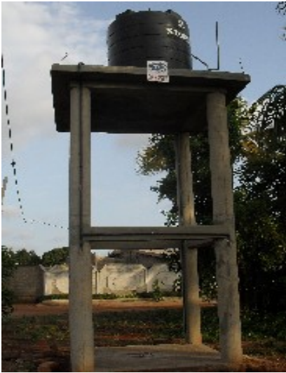
Approvisionnement en Eau Potable (AEP) Construction de château d'eau villageois