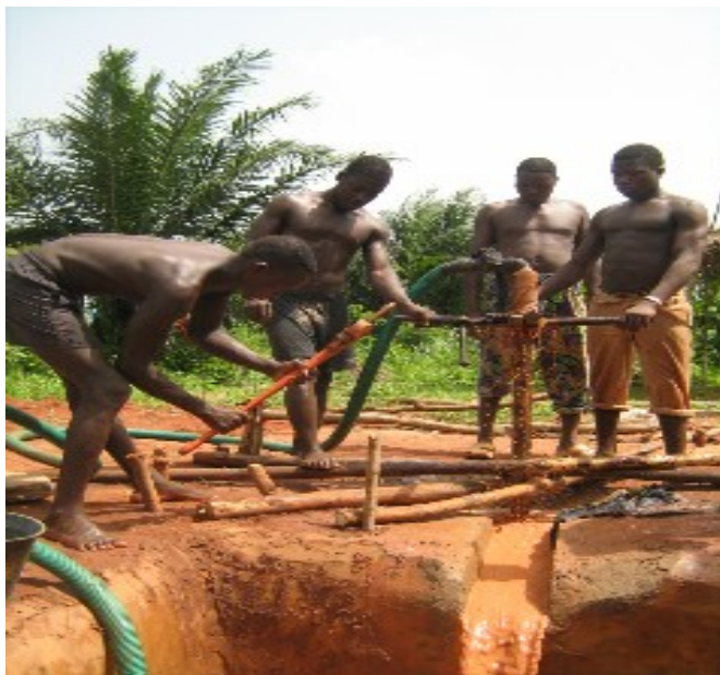
Adduction d'Eau Villageoise (AEV) FORAGE DE PUIT